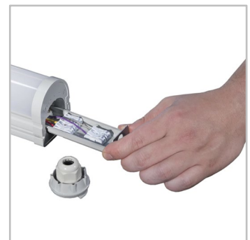
Conexiunea electrică se face pe șină. INDU LINE GEN3 este echipat cu conector tip răsucire și blocare care nu necesită unelte.