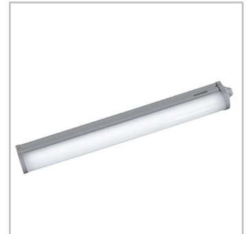
INDU LINE GEN3 oferă o iluminare fără strălucire nedorită pentru condiții de lucru confortabile.