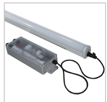
În caz de urgență, o baterie auxiliară opțională poate alimenta INDU LINE GEN3 timp de 3 ore pentru a oferi iluminat de siguranță.